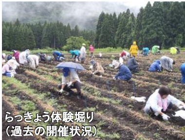
らっきょう体験掘り (過去の開催状況)