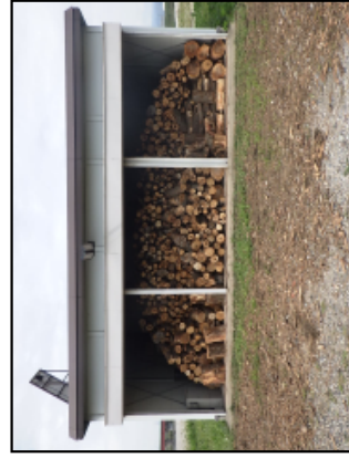
提供する樹木の集積状況