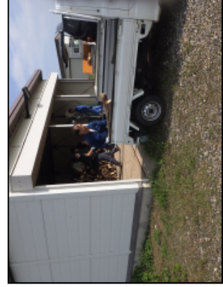
過去（6/27） の配布状況 水防倉庫前での配布 となります