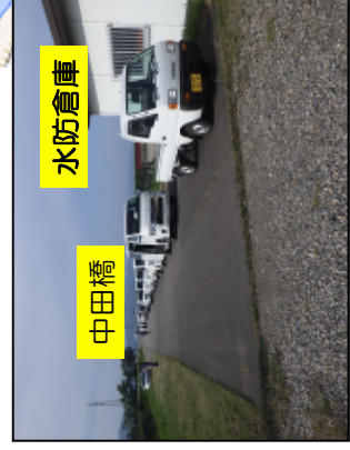
過去（6/27） の配布待状況 [10台前後配布待ち]