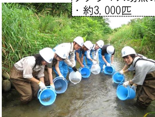
(イメージ) 幼魚放流の様子