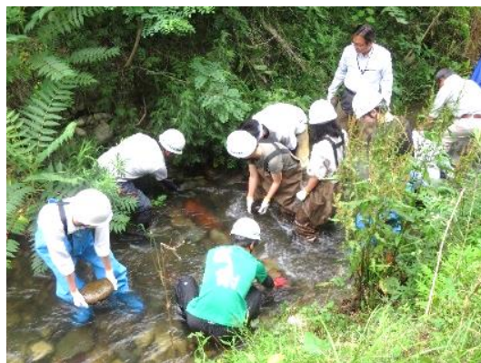
(イメージ) 石組み工体験の様子