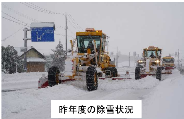
昨年度の除雪状況