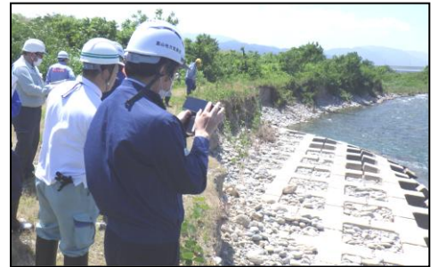
（参考：前年度実施状況）