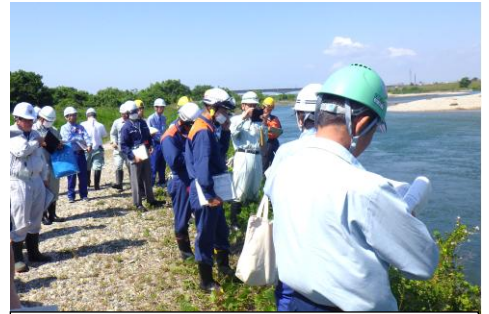
(参考: 前年度実施状況)