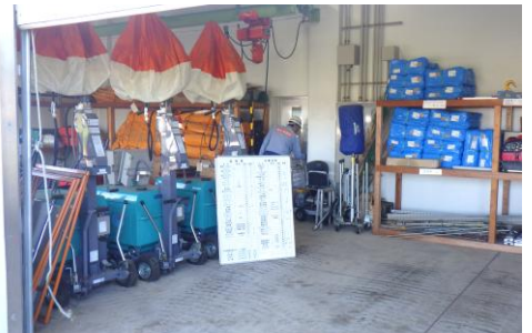
(参考: 前年度実施状況)