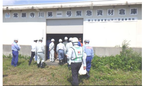
(参考:前年度実施状況)