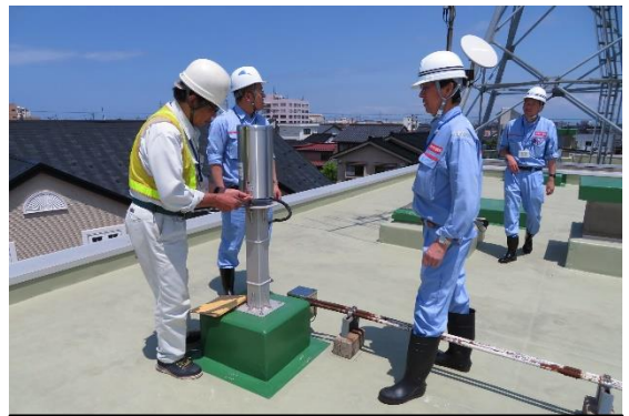
過去の雨量観測所点検状況