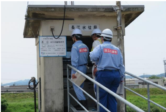
過去の水位観測所点検状況