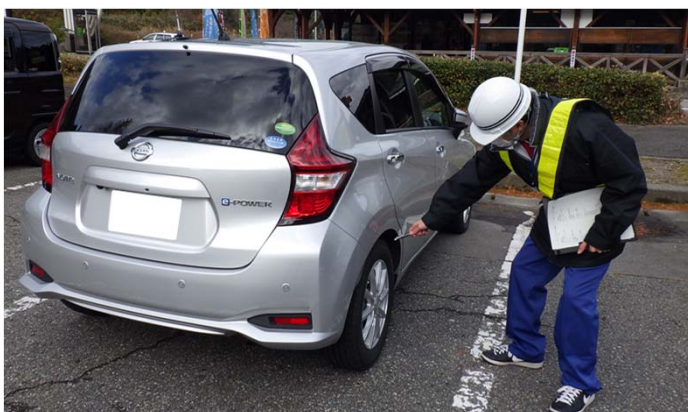
R2. 12. 7 調査状況