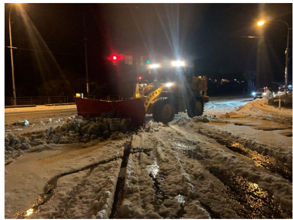
国道8号 朝日町境における作業状況