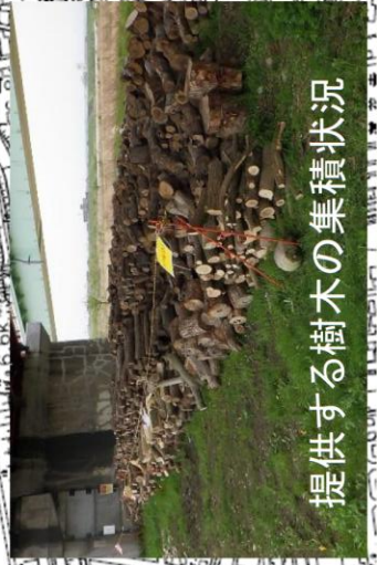
提供する樹木の集積状況