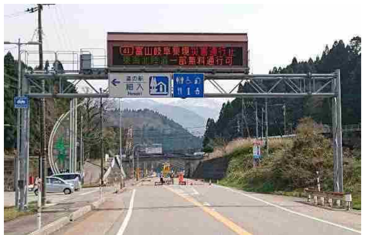
「道の駅」細入から岐阜県側を望む