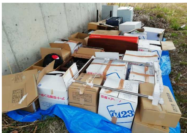
粗大ゴミ（生活用品）