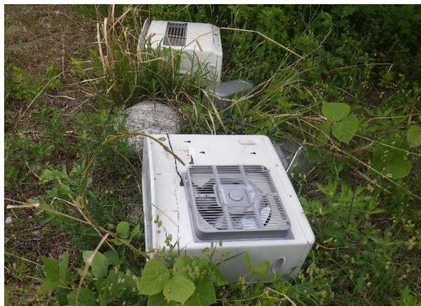
粗大ゴミ（ファンヒーター 2台）