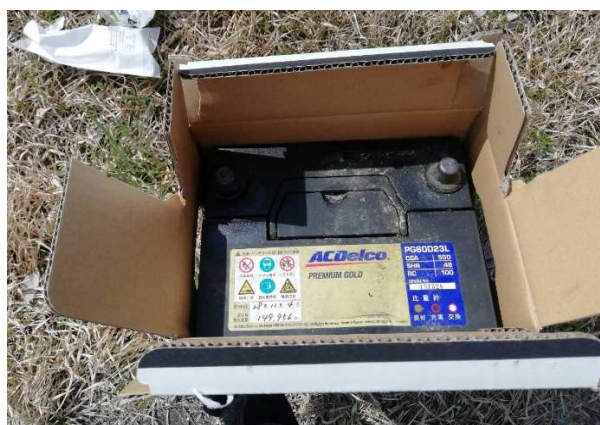
粗大ゴミ（バッテリー） ※熊野川