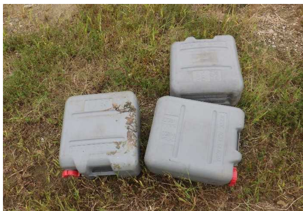
粗大ゴミ（特殊ポリタンク）