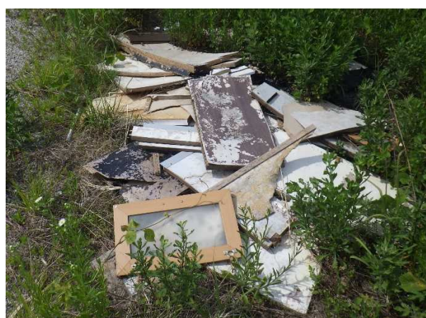
粗大ゴミ（解体された家具）