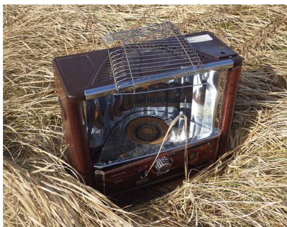
粗大ゴミ（石油ストーブ）