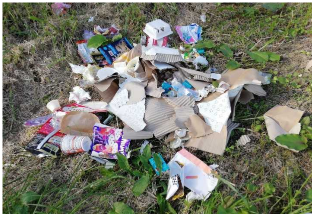
混合ゴミ（紙、プラ容器、空袋他）