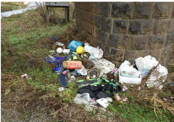
混合ゴミ（ポリタンク、日用雑貨類）