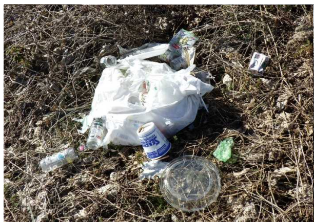
可燃ゴミ（飲食容器他） ※井田川