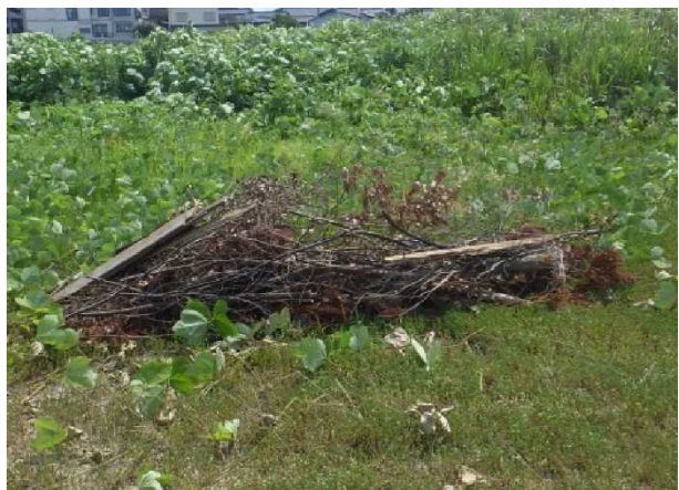
可燃ゴミ（廃材、剪定樹木）