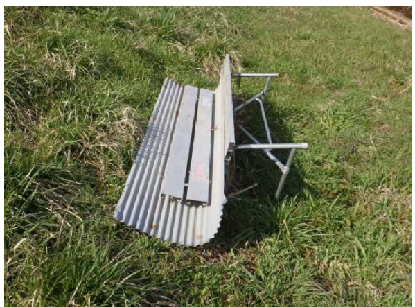
粗大ゴミ（ベンチ、トタン）