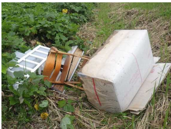
粗大ゴミ（収納ケース、木製椅子）