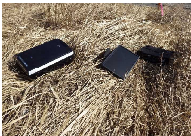
粗大ゴミ（空気清浄機、液晶モニター他）