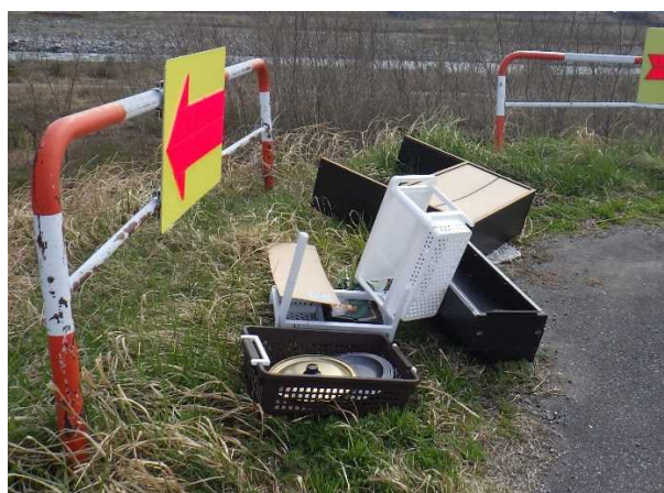
粗大ゴミ（本棚、収納ワゴン、鍋蓋）