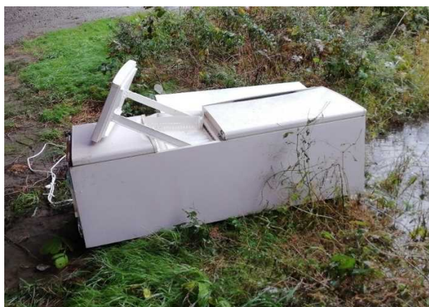
粗大ゴミ（冷蔵庫 大小2台）