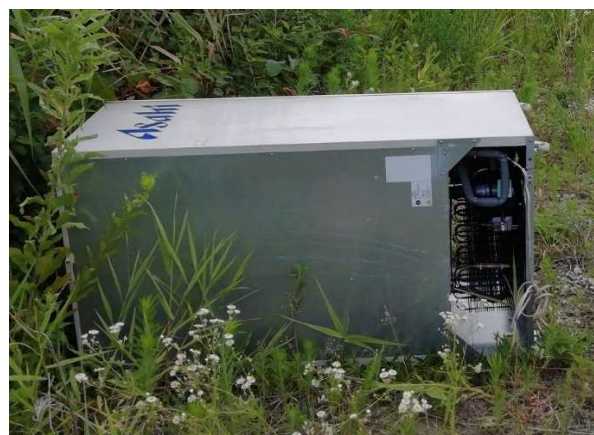
粗大ゴミ（業務用冷蔵庫）