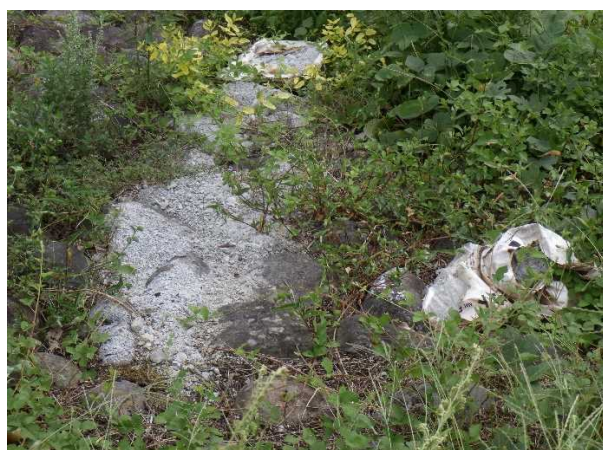
粗大ゴミ（セメントのくず）