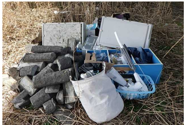
混合ゴミ（コンクリートブロック他）