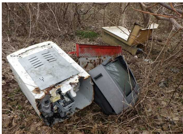
粗大ゴミ（洗濯機、ブラウン管TV、 ユニットバス他）