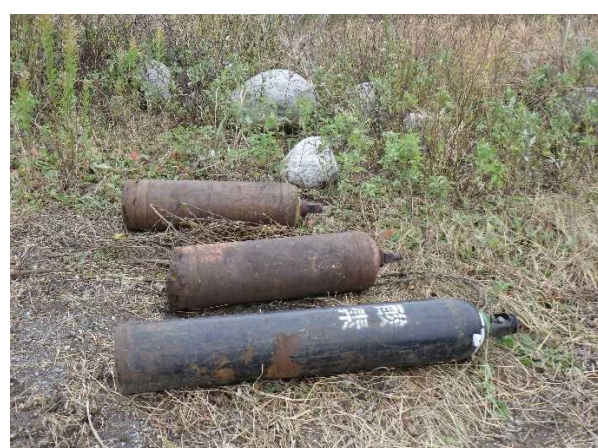
粗大ゴミ（酸素ボンベ 他2本）