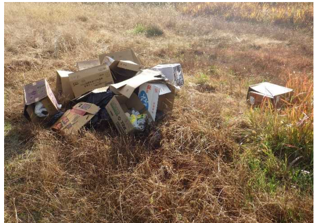
混合ゴミ（ハットボトル、段ボール箱）