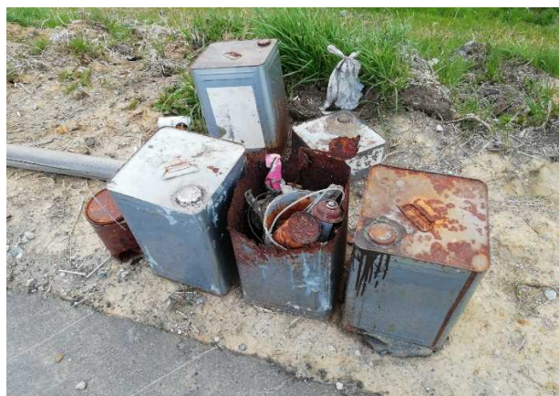
粗大ゴミ（使用済み 塗料缶）