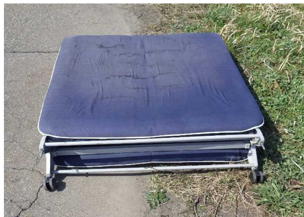
粗大ゴミ（折りたたみベッド）