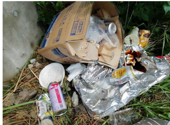
混合ゴミ（バーベキューあと）