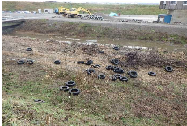
粗大ゴミ（古タイヤ30本）