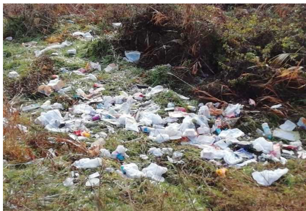
混合ゴミ（ペットボトル他） ※井田川