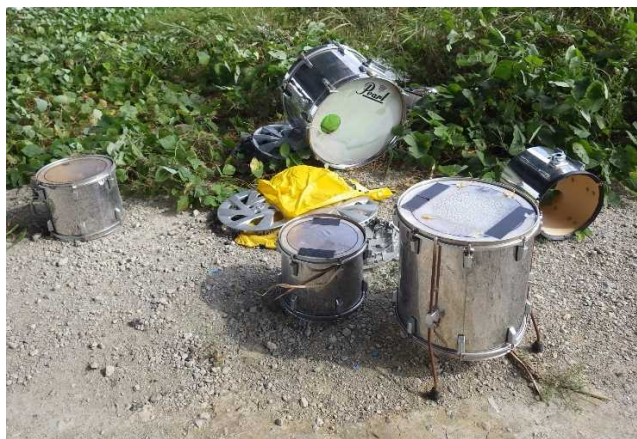
粗大ゴミ（楽器：ドラム他）