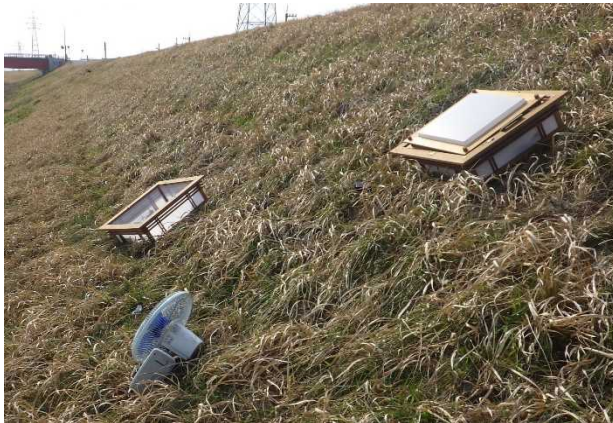
粗大ゴミ（照明器具、扇風機）