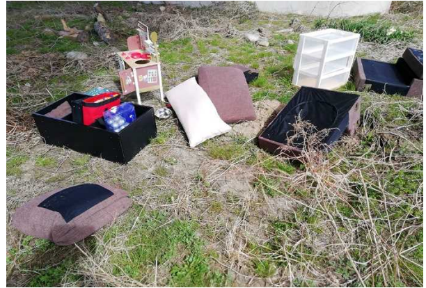
粗大ゴミ（ソファ、収納ボックス他）