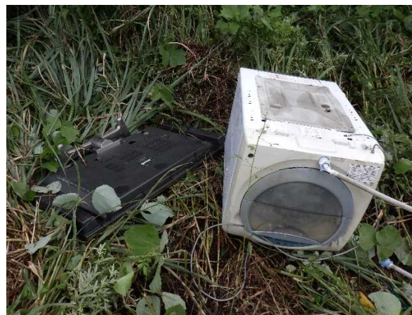
粗大ゴミ（テレビ、洗濯機）