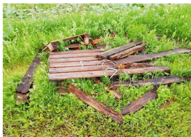
粗大ゴミ（木製パレット） ※井田川