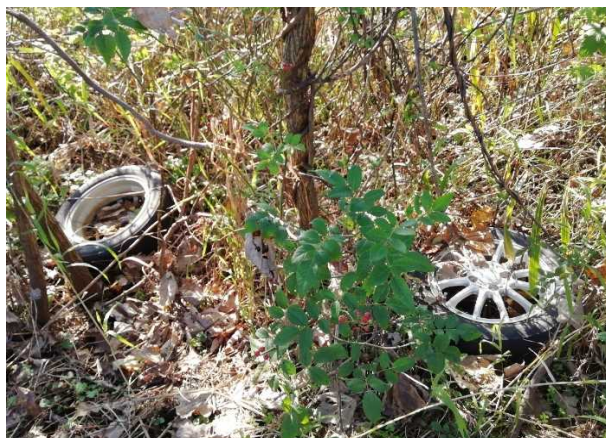
粗大ゴミ（タイヤ4本） ※熊野川