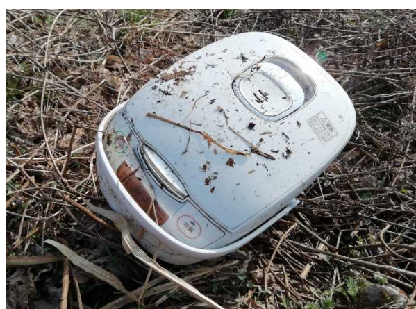
粗大ゴミ（炊飯器） ※熊野川