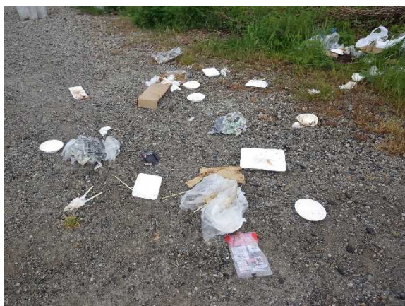
混合ゴミ（バーベキューあと）