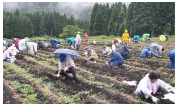
らっきょう体験掘り