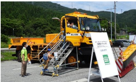
除雪車の試乗体験