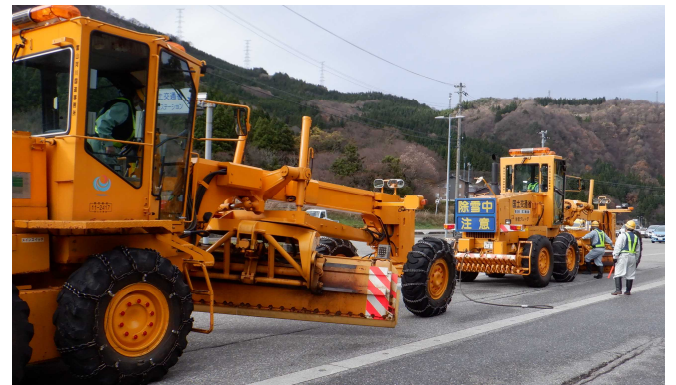
昨年度(R4.11.29)の訓練状況