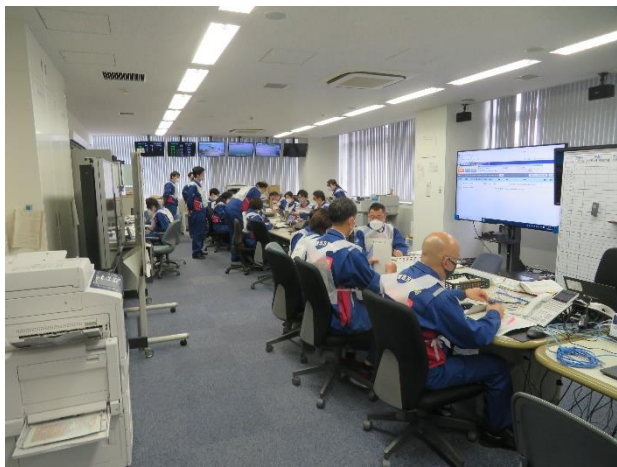
昨年度の演習状況