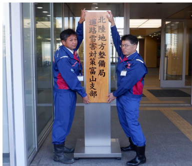
昨年度の看板掲式