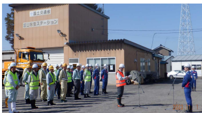
昨年度の除雪出動式