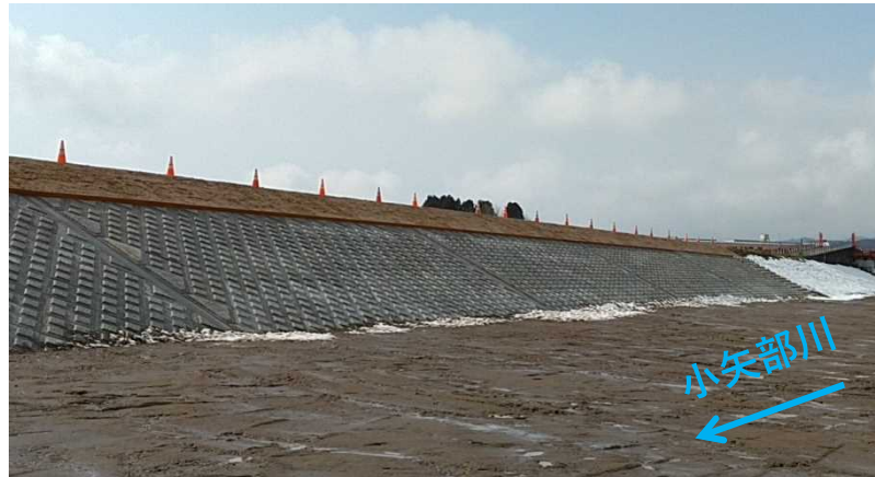
【長江工区】 小矢部川R9.8KP

【長江工区】 大型ブロック張が完了し、ブロック上の植生のみとなりました。寒い日が続く中、春になって暖かくなり、芝が元気に育つ光景が楽しみです。 【福町工区】 今年も、たくさんの雪が降りました。みんなで除雪し、なんとかブロック張が完了しました。完成まで、あと少し、楽しみです。