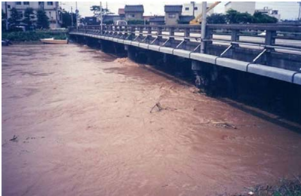
平成 10 年 9 月 白岩川