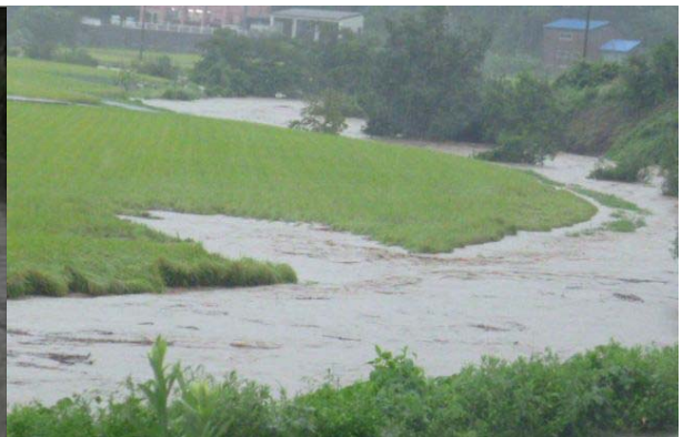
平成 25 年 9 月 子撫川