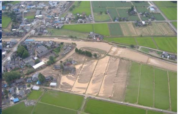
平成 20 年 7 月 小矢部川水系山田川