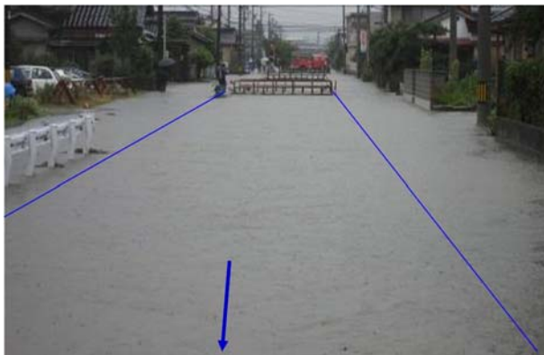
平成 20 年 7 月 坪野川