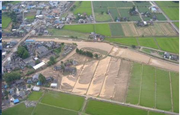
平成20年7月 小矢部川水系山田川