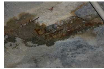
覆エコンクリートの剥落・貫通ひびわれ