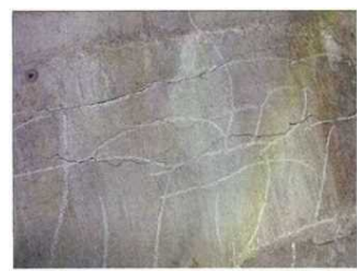
下部工のひび割れ