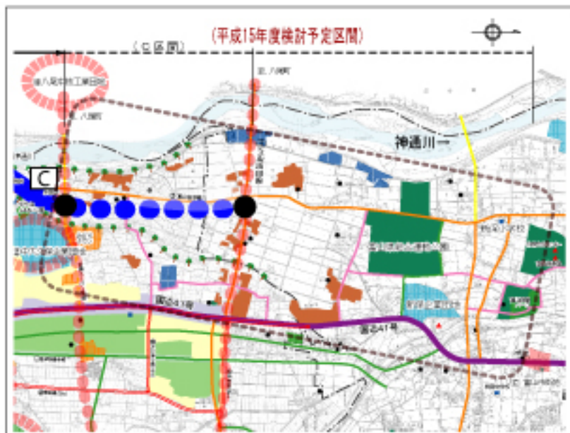
図. 塩IC～国道41号接続地までの範囲位置図

また、インターチェンジの配置については、これまでに検討した区間を含め一体的に考えてまいります。