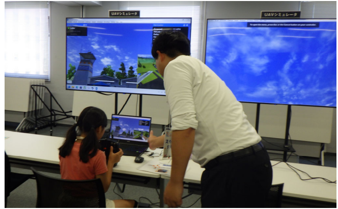
災害対策室 / DX体験