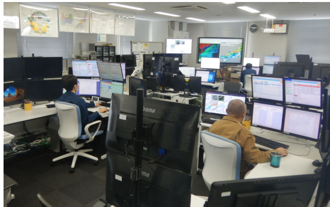
天気解析・予報（現業室）