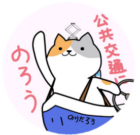
公共交通利用促進キャラクター“のりたろう”