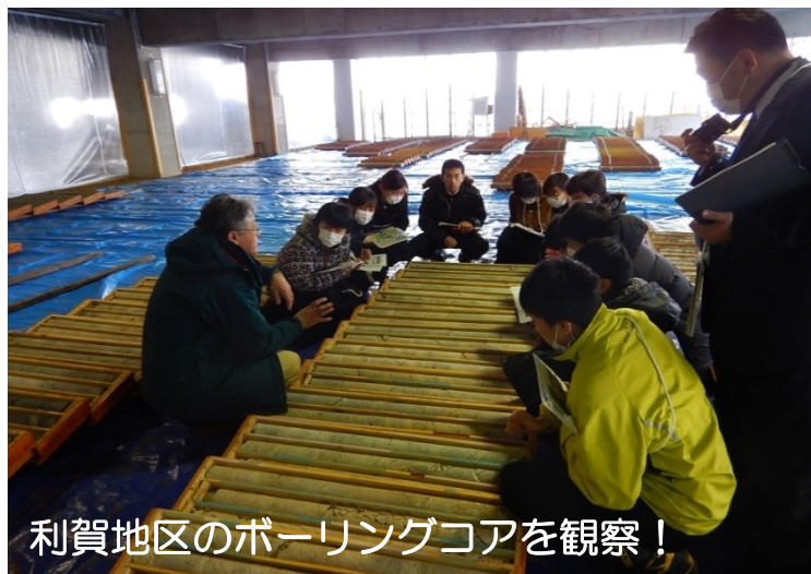
利賀地区のボーリングコアを観察！

生徒たちは熱心に説明を聞いており、終了後には「地元の地面がいつの時代に出来たのかが分かった。」や「きれいなコアで岩の違いがよく分かった。」などの感想の他にも、「構造物を造るために地質調査をすることを初めて知った。」など、ダム事業についての感想も出ていました。