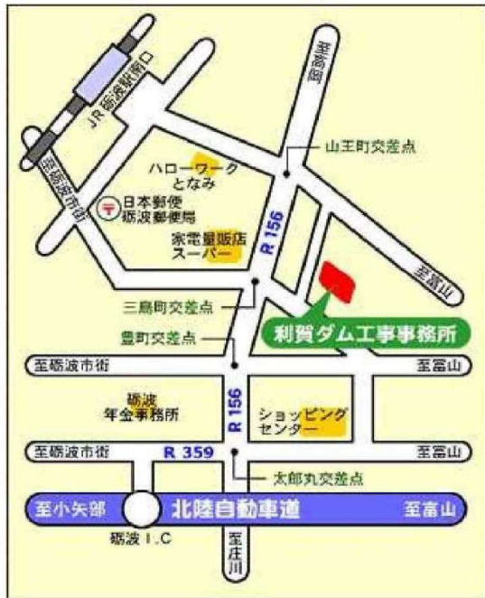
利賀ダム工事事務所位置図