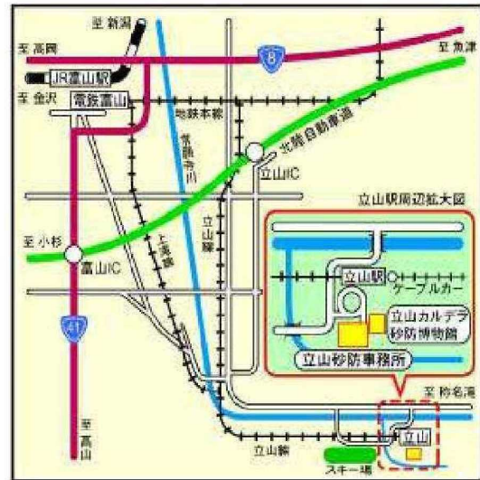
立山砂防事務所位置図