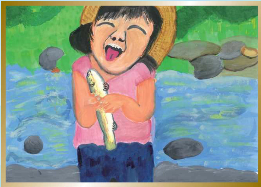
平成28年度 金賞作品

★同時開催★ 本宮砂防堰堤80周年特別企画 常願寺川 水辺の楽校 絵画コンクール