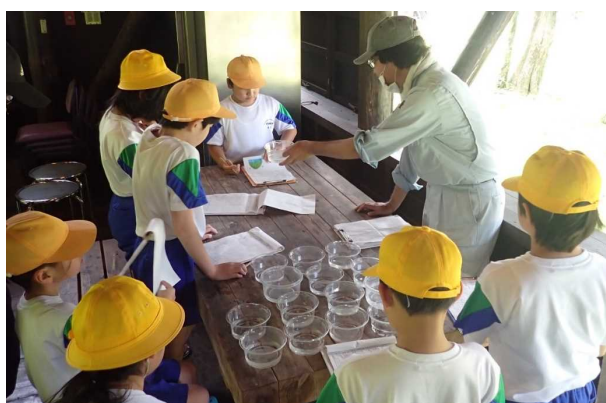
令和3年7月「水生生物調査」の様子