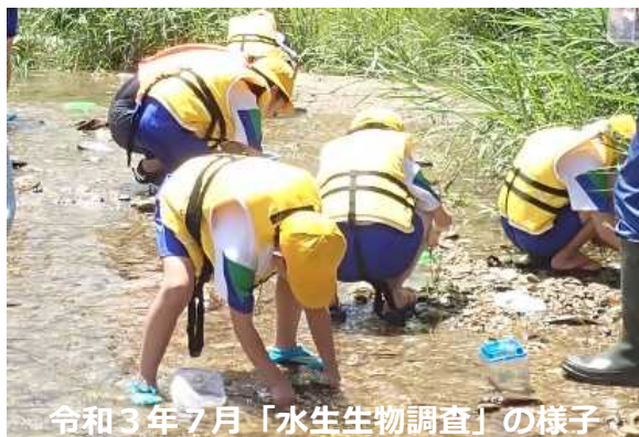
令和3年7月「水生生物調査」の様子