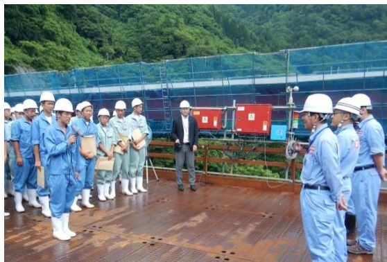
H29.7 見学会状況（代表生徒による挨拶） （利賀ダム庄川橋梁上部工事にて）