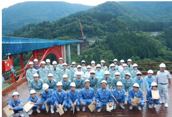
H29.7 見学会状況（集合写真） （利賀ダム庄川橋梁上部工事にて）