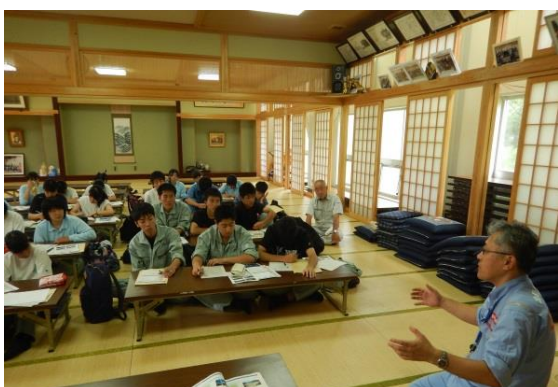
H29.7 見学会状況（座学にて）