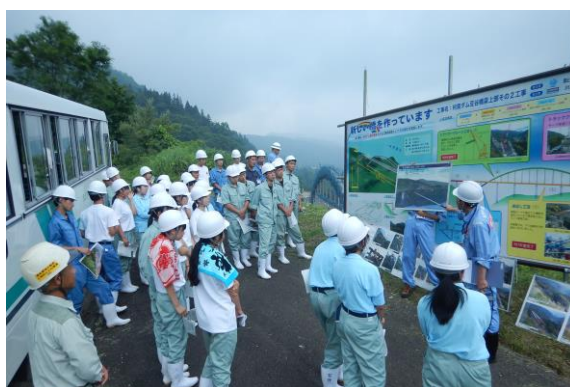
H29.7 見学会状況 （利賀ダム豆谷橋梁上部その2工事にて）