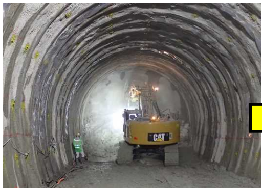
トンネル掘削作業中