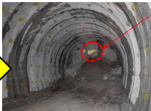
トンネル貫通の様子