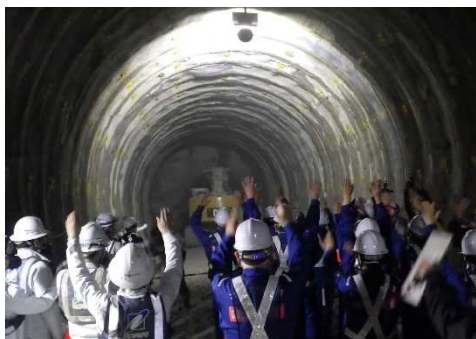
関係者で万歳三唱