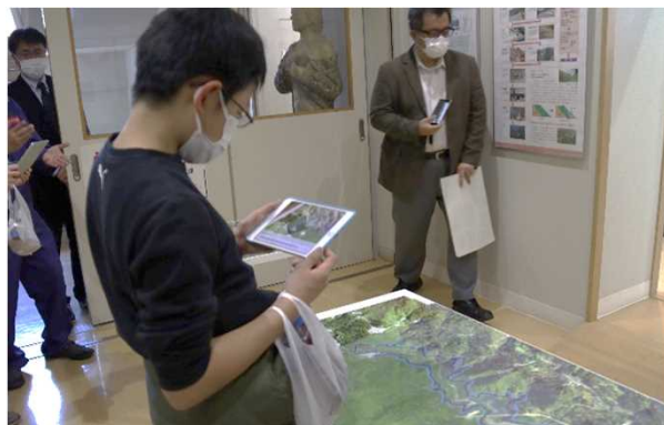
タブレットを使ったAR