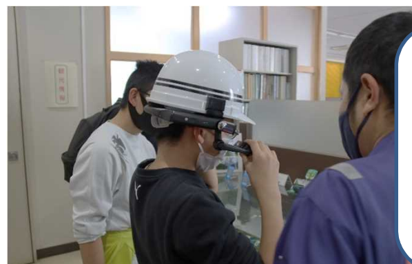
スマートグラス操作体験