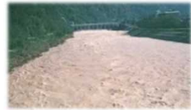
H16.10.台風23号 庄川洪水観測史上最高水位を記録 2,840名に避難勧告

庄川の洪水氾濫から沿川地域を守り、また、急流河川特有の流水の強大なエネルギーから堤防の安全性を確保するため、利賀ダム地点において毎秒500立方メートルの洪水調節を行い、下流全川にわたり洪水の流量の低減を図ります。