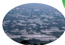
散居村の広がる庄川扇状地

庄川流域では、高岡銅器などの伝統産業の集積を土台として、豊かな水や電力を背景に立地したもののづくり産業が集積しています。また、北陸自動車道、能越自動車道、東海北陸自動車道の整備に加え、平成26年度には北陸新幹線の開業など、広域交通ネットワークの整備により、さらなる発展が期待される地域です。