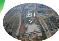
庄川を渡る北陸新幹線

利賀ダムは、流域の豊かな暮らしや活発な産業活動を守り、さらに発展する地域づくりに寄与します