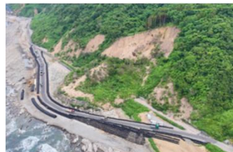
震災からの復興・復旧(国道249号)