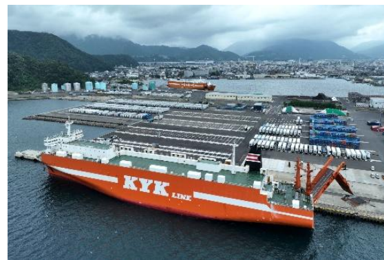
敦賀港複合一貫輸送ターミナル整備事業(福井県敦賀市)