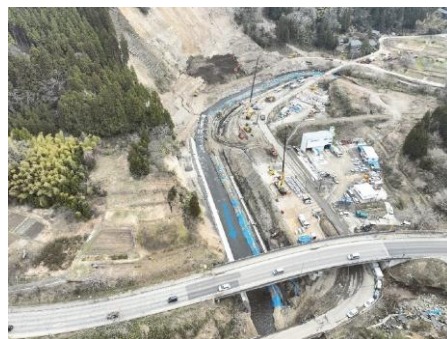
河原田川河川護岸の本復旧(石川県輪島市)