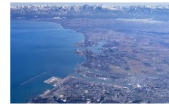
伏木富山港湾脱炭素化推進計画 (富山県富山市・射水市・高岡市)