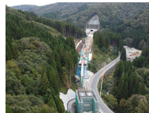
中部縦貫自動車道(大野油坂道路)(福井県大野市)