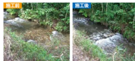
神通川自然再生事業(幼魚の生息場の造成) (富山県富山市)