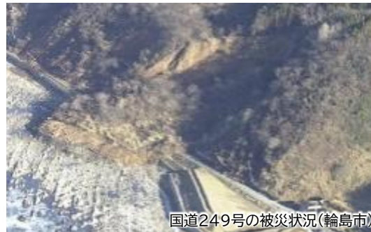
国道249号の被災状況(輪島市)

➢ 観光需要の回復・高まりへの対応と交通ネットワークの更なる強化 ➢ 関係人口の拡大や新しい交流圏の形成