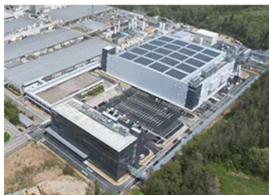
パワー半導体工場の新設(石川県能美市)

○太平洋側のバックアップ機能の確保及び三大都市圏と等距離にある地理的優位性を生かして、電子デバイス街道の形成など、競争力のある産業を育成