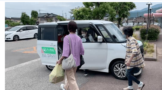
共助型公共交通(富山県朝日町)