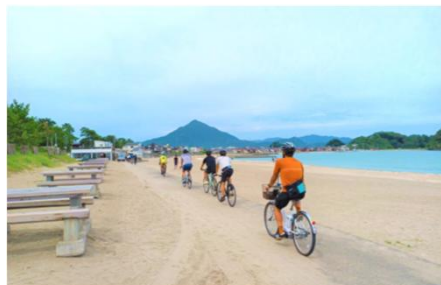
若狭湾サイクリングルート(福井県高浜町)