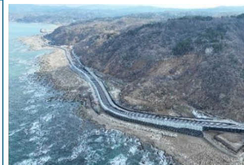
国道249号沿岸部の応急復旧 (石川県輪島市)