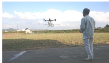
出典.スマート農業導入事例(北陸農政局HP) 農薬散布用ドローン導入 (福井県越前町)

○震災等からの創造的復興による農林水産業の持続的な発展に向けた農山漁村の活性化、コメ・日本酒等の「北陸ブランド」の魅力を生かした産業の活性化