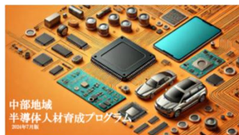
出典.中部地域半導体人材育成プログラム(中部経済産業局) 中部地域の半導体産業を担う 人材の育成・確保

○震災等からの創造的復興による伝統工芸産業等の事業再建・継承及び北陸圏の優れた人材の育成・定着に向けた魅力的な就業機会を増やす取組を推進