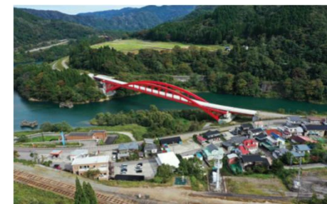
富山高山連絡道路(猪谷楡原道路) (富山県富山市)