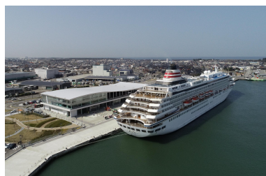
金沢港クルーズターミナル (石川県金沢市)