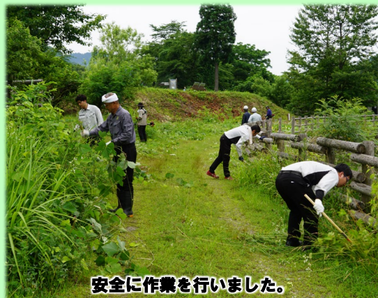
安全に作業を行いました。