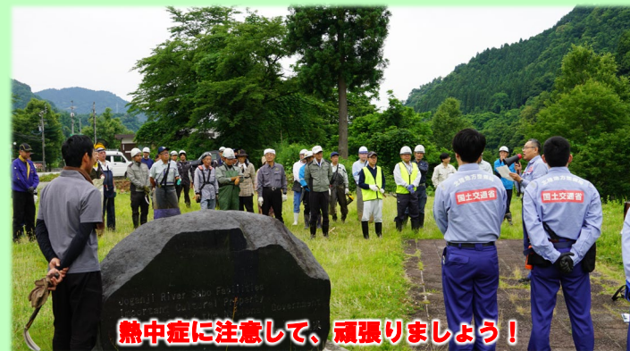
熱中症に注意して、頑張りましょう！