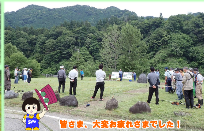
皆さま、大変お疲れさまでした！