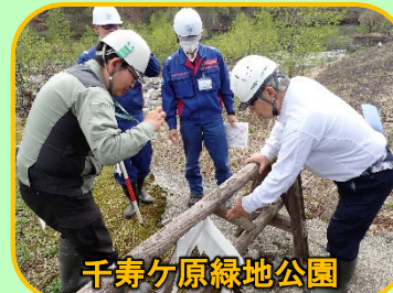
千寿ヶ原緑地公園