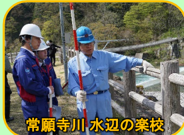
常願寺川 水辺の楽校