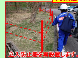
立入防止柵を再設置します。