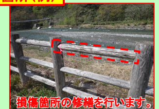
損傷箇所の修繕を行います。