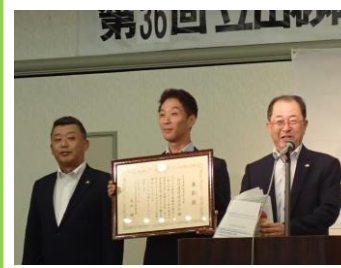
新栄建設株式会社