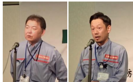
千寿ヶ原地区 (保全対策官(工事)) 水谷地区 (水谷出張所長)