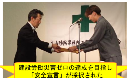
建設労働災害ゼロの達成を目指し「安全宣言」が採択された