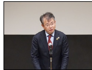
武隈 義一 黒部市長