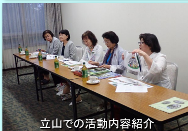
立山での活動内容紹介