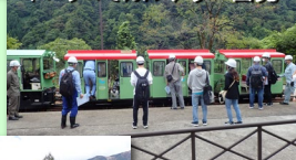
トロッコでカルデラへ出発