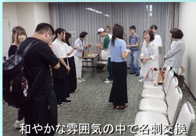
和やかな雰囲気の中で名刺交換