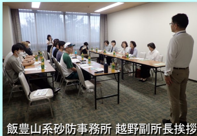
飯豊山系砂防事務所 越野副所長挨拶