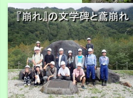
『崩れ』の文学碑と轟崩れ