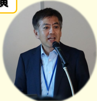
国土交通省砂防保全課 吉野土砂災害対策室長