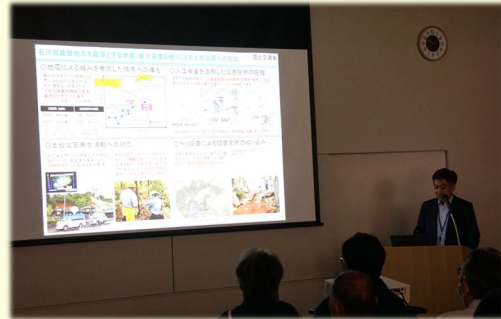
「砂防関係工事における 施工技術等に関する取り組み」