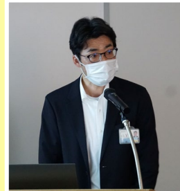
「富山県における建設業の担い手 確保に関する取り組みについて」