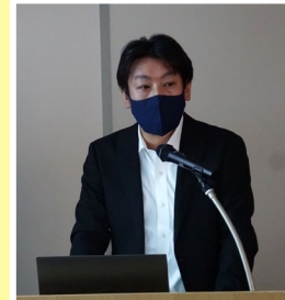
「R4常願寺川流木対策工事の安全対策について」