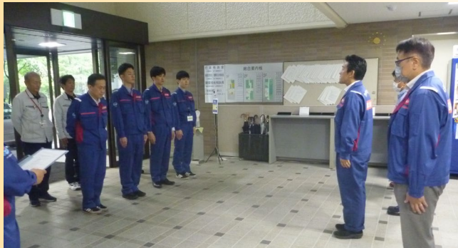
寺崎出張所長の宣誓