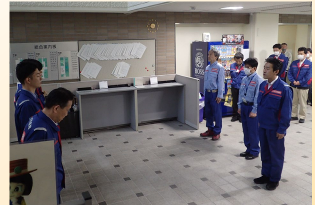
石田事務所長より激励の言葉