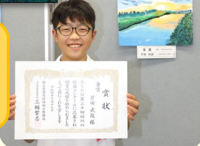
【夕日に染まる白岩川】

＜講評＞ 夕日が水面に映り、力強く輝いています。雲の描き分けにより、夕空のドラマチックさが伝わってきます。