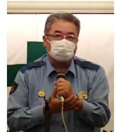
富山県上市警察署長