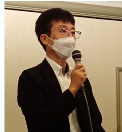
立山砂防事務所長