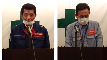
千寿ヶ原地区 （保全対策官（工事））