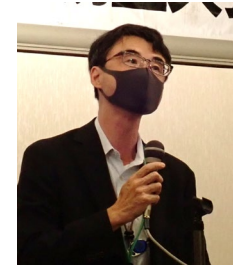
富山労働基準監督署長