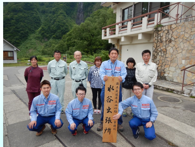
今年5月時点の上山時の出張所職員一同

今年も、新型コロナウイルス感染症の影響下の中、関係者一同、感染拡大防止など、より一層の安全対策に努め、重大事故もなく下山日を迎えることができました。