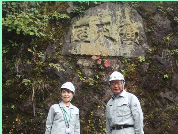
新田八朗富山県知事視察