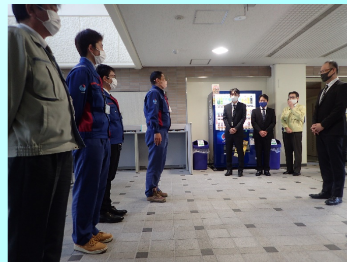
下山報告する出張所の皆さん