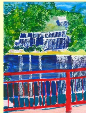
【夏の砂防ダム】 低学年の部