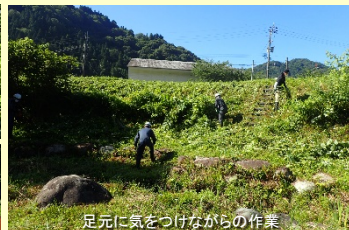
足元に気をつけながらの作業