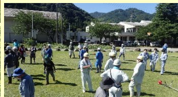
作業終了後は、冷たい飲み物でクールダウン!!