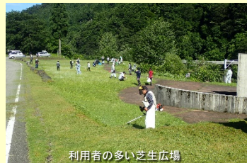
利用者の多い芝生広場