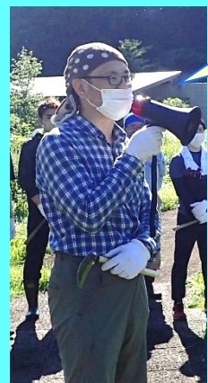
挨拶：野呂事務所長