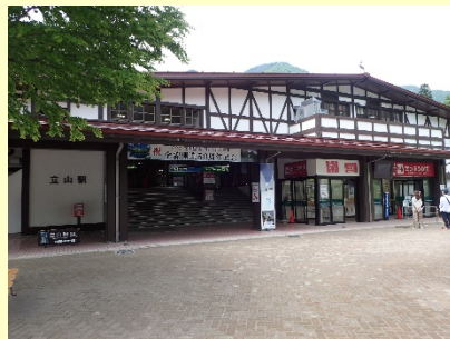
富山地方鉄道立山駅