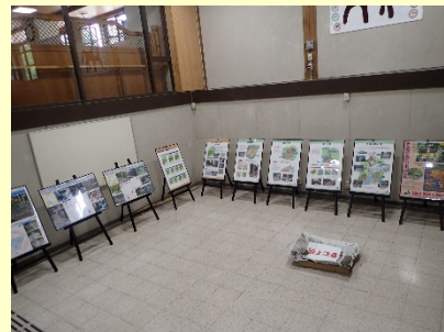
パネルの展示状況(地下1階階段踊り場)