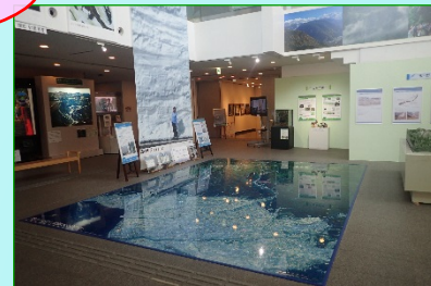
立山カルデラ砂防博物館