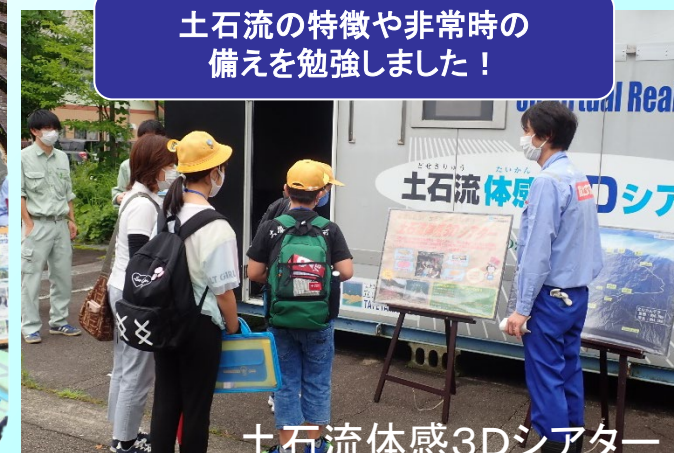
土石流体感3Dシアター