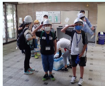
トロッコに乗車 いってきま～す！