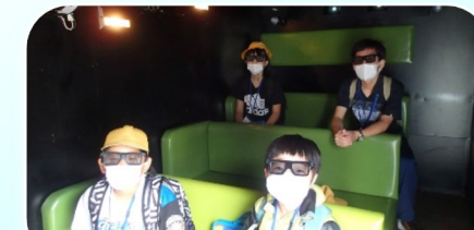
土石流の特徴や非常時の備えを勉強しました！