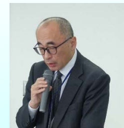
大坂委員挨拶 （立山砂防事務所長）