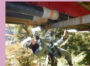
橋桁たたき点検状況

立山砂防事務所HPのコンテンツ「立山軌道トロッコ」に「立山砂防のトロッコ」に関する情報が掲載されています。是非、ご覧になって下さい！