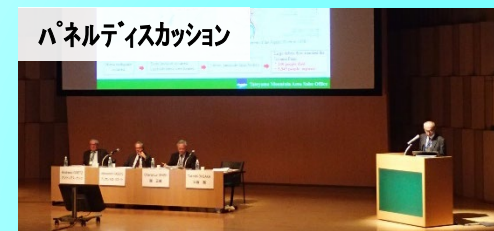
大坂 事務所長による立山砂防の紹介