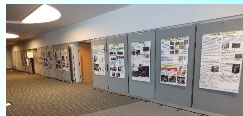
行政パネルの展示状況