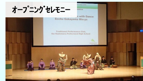
富山の郷土芸能「こきりこ」の披露