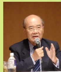
パネリスト 松浦 晃一郎 氏 (第8代ユネスコ事務局長)