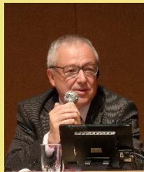
パネリスト アンドレアス・ゲッツ 氏 (元スイス環境庁次官)