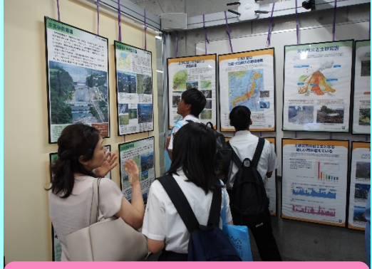
パネル展示で土砂災害や砂防堰堤の役割を学ぶ姿も