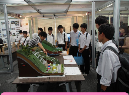
ミニ模型で土砂災害について学ぶオープンキャンパスの参加者