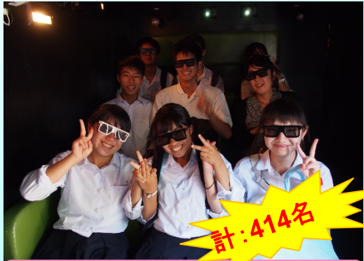
土石流体感3Dシアター体験人数 1日目:264名 2日目:150名 計:414名