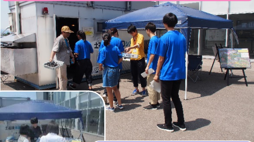
解説員による立山砂防事務所の事業紹介も